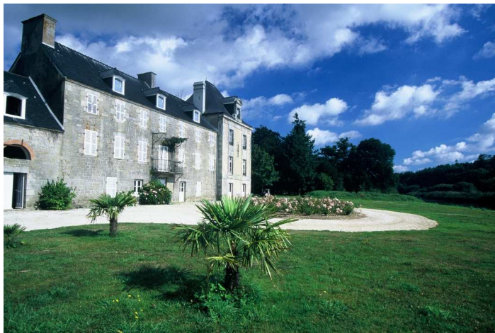
Le manoir de Saint-Urchaut

C'est aussi l'occasion de découvrir la ville de Pont-Scorff et le Bas-Pont-Scorff au riche passé historique : Maison et place des Princes, pont Saint-Jean, chapelle Notre-Dame de Bonne Nouvelle... Laissez-vous tenter par son patrimoine culturel : la Cour des Métiers d'Art et les artisans d'art, l'Espace Pierre de Grauw, l'Atelier d'Estienne et les expositions d'art contemporain (notamment « L'Art Chemin Faisant » parcours d'art en été), l'Odysseum (espace de découverte du Saumon Sauvage), la Maison du Scorff.