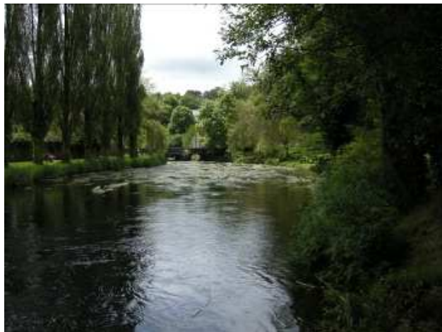
Le Scorff au Bas-Pont-Scorff