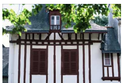
Maison à pan de bois Place de la Maison des Princes