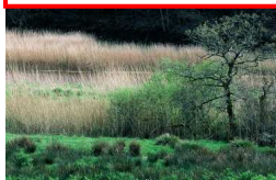
La roselière du Scave

Les sentiers sont aménagés sur domaines public et privé. Respectons la nature et les aménagements, les propriétés privées (clôtures...) et les activités agricoles (animaux...).